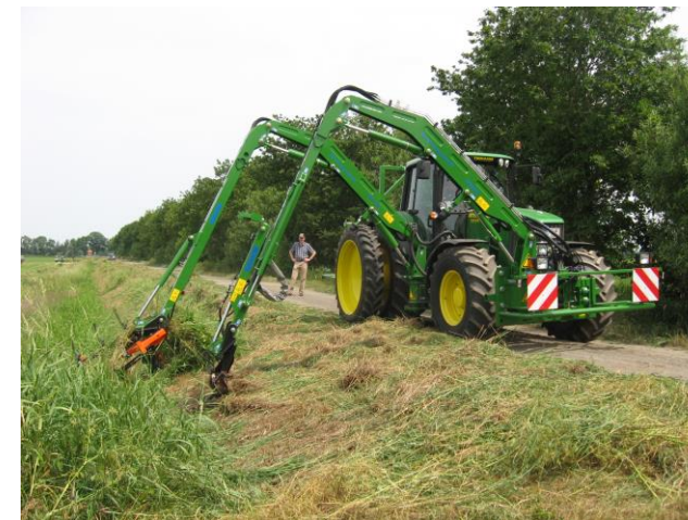
Mäh-, Harkkombination am Schlepper

In den Schöpfwerken stehen 260 Pumpen mit einer Leistung von 30 bis 5.000 l/s. Die jährlichen Stromkosten betragen jetzt im Mittel 910.000,- Euro (+ 160 % gegenüber 2002).