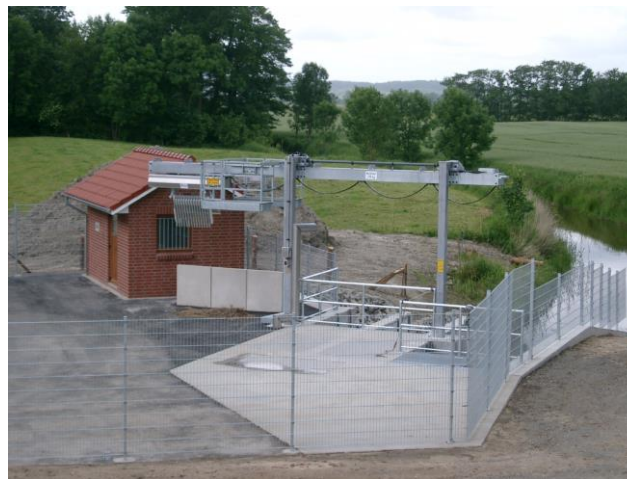
Schöpfwerk Braaker Schleusenfleth nach Neubau 2010

Die große Zahl der Anlagen erfordert ständige Investitionen in die Bauwerkserhaltung und die Erneuerung der technischen Anlagen. In den Jahren 2000 bis 2018 wurden dafür Mittel in Höhe von ca. 16,5 Mio. € aufgebracht. Allein für die Grundsanierung des Schöpfwerkes Aue in Neuhaus im Zeitraum 2007/2008 mussten 1,8 Mio. € aufgewendet werden. 2009 / 2010 erfolgte der Neubau der Schöpfwerke Braaker und Hemmer Schleusenfleth mit Baukosten von insgesamt ca. 1,7 Mio. € und einer Förderung aus dem Konjunkturprogramm II. Der Neubau des Schöpfwerkes Burgbeckkanal im Rahmen der dortigen Deichbaumaßnahme kann evtl. 2019 beginnen.